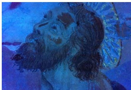
Dettaglio : visibili i ritocchi pittorici e le fluorescenze, lampada a luce UV.