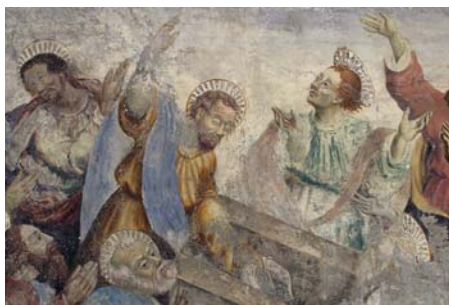
Dipinto dell' Assunzione della Beata Vergine , SSSI di Bellinzona.

Ricerca storica e valutazione dello stato di conservazione de l'Assunzione della Beata Vergine e La messa di S. Carlo