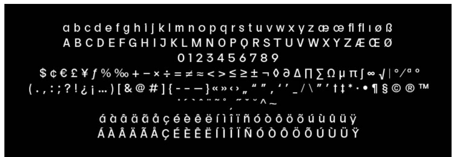
2. Carattere completo