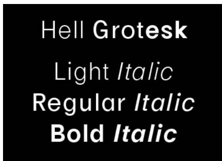
1. Varie versioni